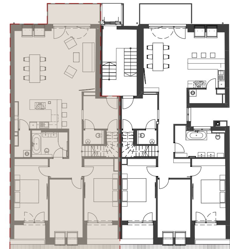
Übersicht 1.DG M 1:200