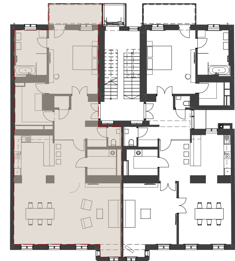
Übersicht 2.Stock M 1:200