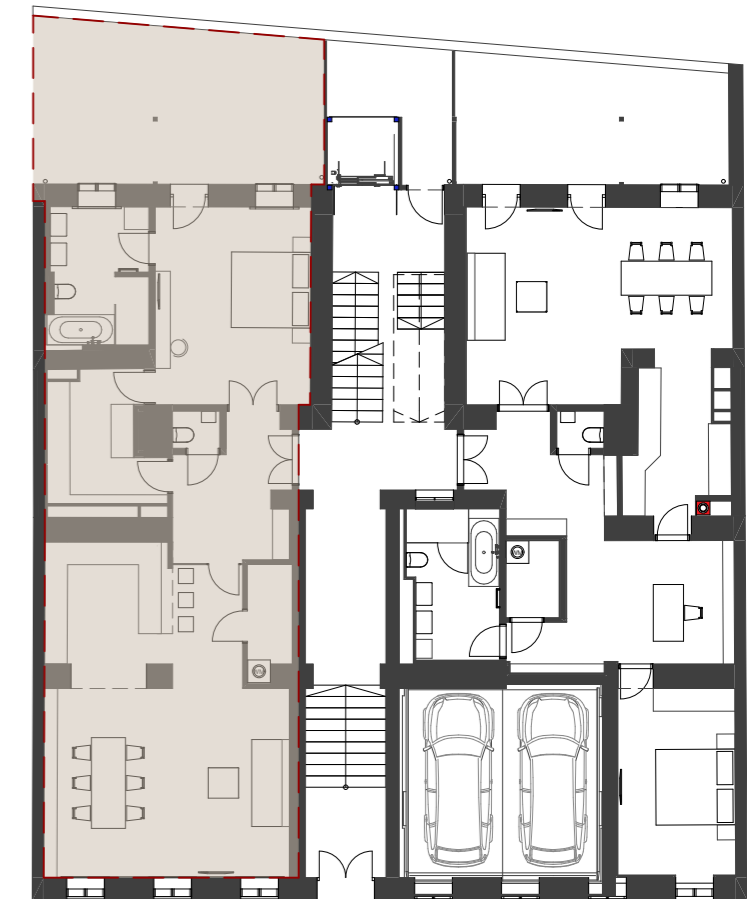
Übersicht Hochparterre M 1:200